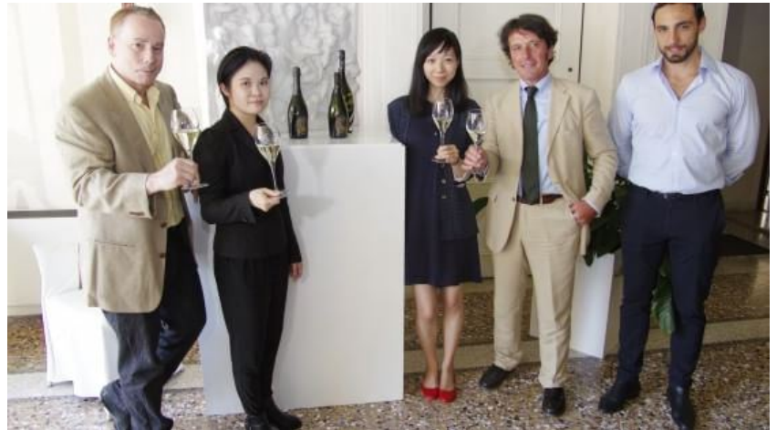
La presentazione dell'accordo tra il Consorzio di tutela del Prosecco e la Scuola di Shanghai

Accordo tra il Consorzio e la Shanghai Trade School per un corso di lezioni sulle bollicine italiane. Un modo per far crescere l'export e la conoscenza: solo l'1% dell'esportazione complessiva, pari nel 2014 a 200 milioni di bottiglie di Prosecco Doc, prende il volo per la Cina