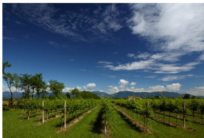
(PRIMAPRESS) TREVISO - Alla luce dei tanto