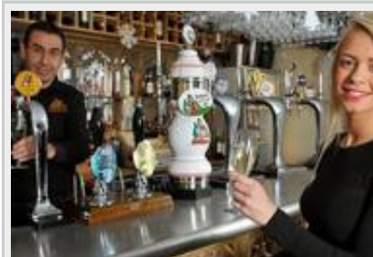
Uno dei pub dove si serve Prosecco alla spina