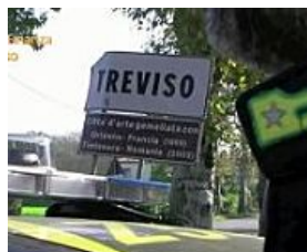
Il blitz della Finanza. Le auto nel garage