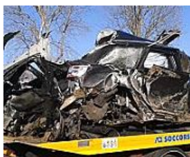
Il recupero dell'auto dopo lo schianto mortale