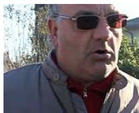
"A tutta velocità sono andati dritti in curva"