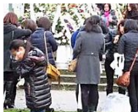
Castelfranco, folla per il funerale cinese