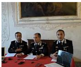
"Fatto ripugnante, pensavano fosse un gioco"