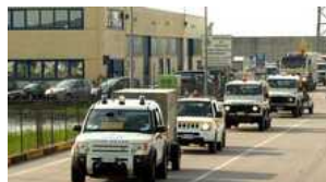
Alluvione nel Modenese, partita una colonna mobile di volontari